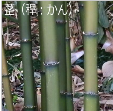
茎 (稈: かん)