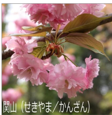
関山 (せきやま/かんざん)

山に咲く「山桜」に対して人里近くに咲く「里桜」。主にオオシマザクラの特徴をもつ桜を総称して「里桜」と呼ぶ。八重の大きな花を咲かせるため人気の品種が多い。関山や、普賢象、一葉、楊貴妃などの他、緑色を帯びた花の鬱金(うこん)や御衣黄(ぎょいこう)がある。