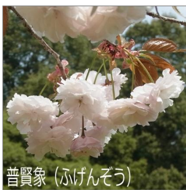
普賢象 (ふげんそう)