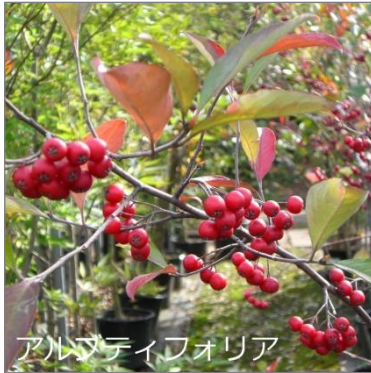
アルブティフォリア