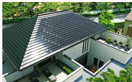
積水ハウスオリジナルの瓦型太陽光発電パネル