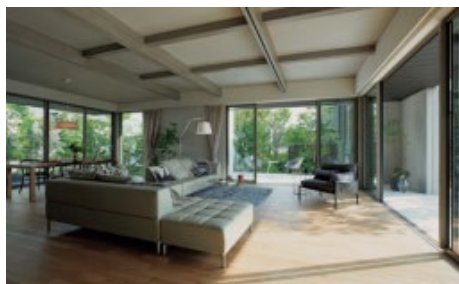
「ファミリースイート」の大空間「5本の樹」計画の庭を望む大開口