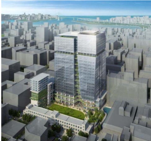
南東上空よりの全景