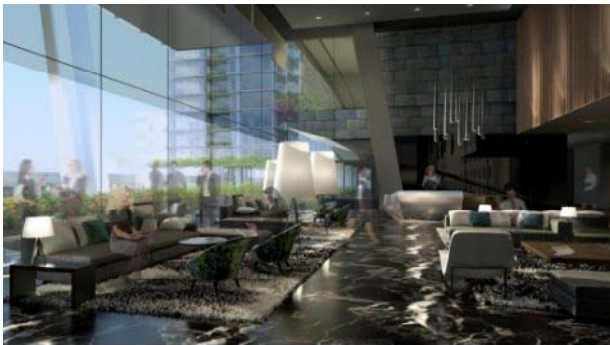
オフィススカイロビー（3階）

総面積約30,000㎡となるオフィスは、基準となるフロアは、ワンフロアの専有面積が約2,500㎡となる九州最大級の自由度の高い計画となっています。加えて高度なセキュリティ機能と十分なBCP性能、耐震性を備えた安全・安心のハイグレードなオフィスです。MICE*機能も備えており、グローバルビジネスを呼び込む事も可能です。また、旧大名小学校南校舎のスタートアップ支援施設と連携し、企業の成長をバックアップするコワーキングスペース、イベントホール等からなる施設構成により、企業の創業や成長、および人材の育成に適した環境を提供します。