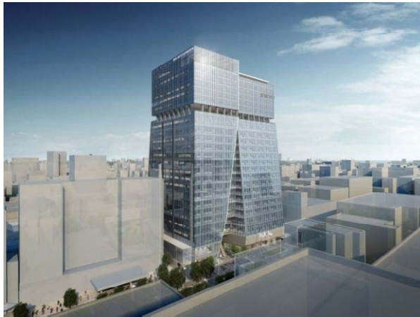
明治通り東側からの全景

旧大名小学校跡地は、地域におけるこれまでの地域活動や災害時の避難場所としての役割を担う場所であるとともに、様々な都市機能や交通拠点が集積する天神地区に隣接し、「天神ビッグバン」の西のゲートとして、都心部の機能強化と魅力づくりを図る上で重要な役割を担う場所でもあります。本プロジェクトでは九州初となるラグジュアリーホテル「ザ・リッツ・カールトン ホテル」が入居し、2022年度の開業を予定しています。162室の客室はすべて広さ50㎡以上の贅沢な空間であり、スパなどの様々な付帯施設も準備しています。