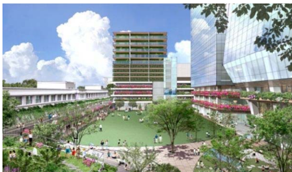
広場東側からオフィス棟を望む

都心にありながら約3,000㎡の広大な広場を設け、イベントホールとの一体的利用による憩い・賑わいの創出や、コワーキングスペースなどによる企業や人材の交流など、世界や地域との多様な交流拠点を目指しています。