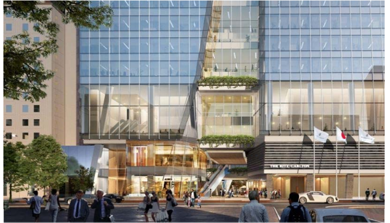
明治通りからの近景