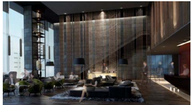
カンファレンスラウンジ（3階）