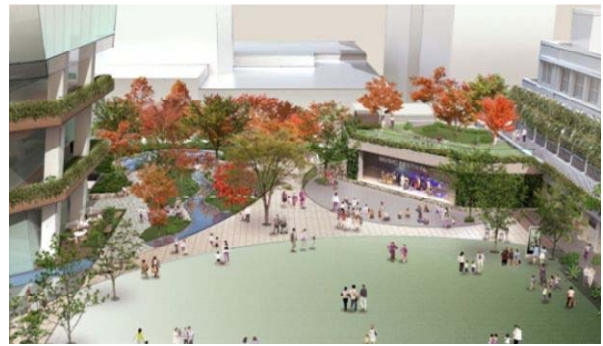
広場西側からイベントホールを望む