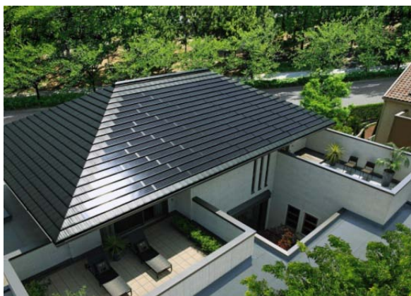
「グリーンファーストゼロ」（ZEH）により、オーナー様の暮らしを脱炭素化