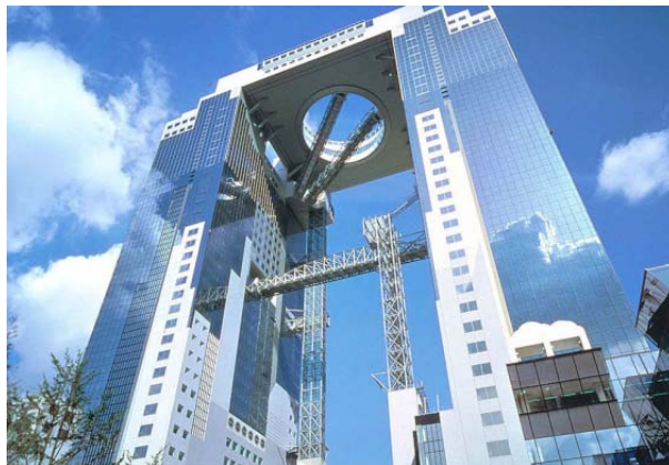
卒FIT電力の買取により、積水ハウスの事業活動を脱炭素化