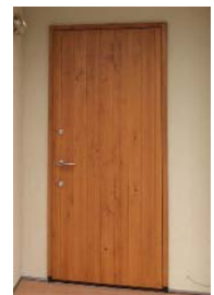
外壁：ガルバリウム鋼板+シーリングレスサイディング 樹脂サッシ+遮熱断熱複層ガラス 木製玄関ドア