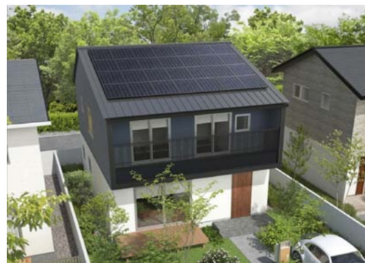
ZEH(ネット・ゼロ・エネルギー・ハウス)にも対応可能