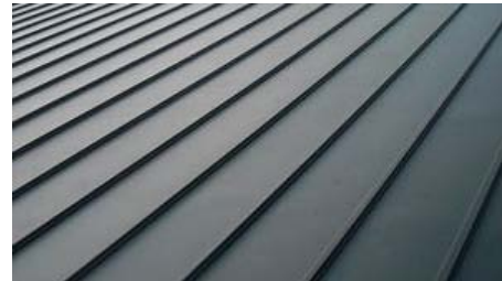
屋根：ガルバリウム鋼板

優れた耐久性を持つガルバリウム鋼板の屋根や外壁、継ぎ目がなく美しさが際立つシーリングレスサイディング、木製玄関ドア（国産ヒノキ材）、樹脂サッシなど、耐久性や意匠性に優れた部材を標準仕様に設定しています。