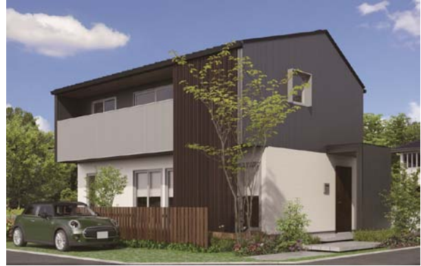
機能とデザインを両立するスタイリッシュで個性的な外観

日差しをコントロールする南面の深い軒など、新しい暮らしを個性的な外観デザインで表現しました。