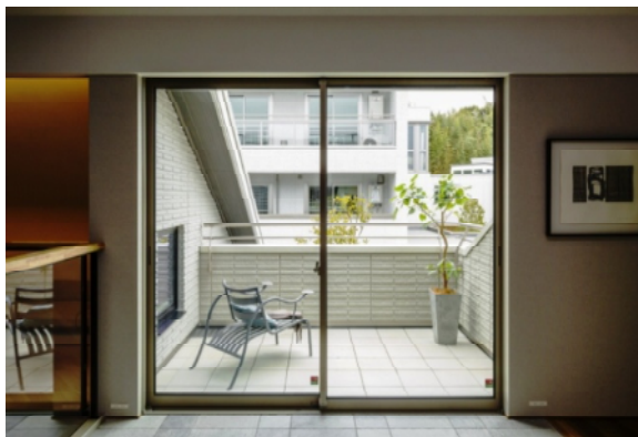
サッシ障子枠のスリム化によりデザイン性がアップ