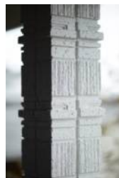
オーナメントピラー