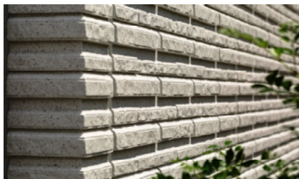
陰影感のある彫の深い「ダイコンクリート」

また玄関ドアに、高級感のある1枚の大判タイルを使用した「グランディーレ」を新設し、オリジナル外壁「ダイコンクリート」の質感や厚みが際立つ新しいデザインと独自の技術により他社にない魅力で進化し続けてまいります。