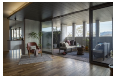
連続配置による印象的なデザイン