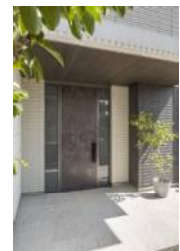
玄関ドア「グランディーレ」