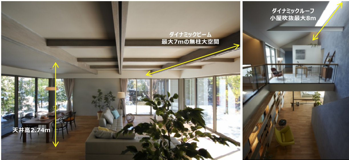
新構法「ダイナミックフレーム・システム」により「スローリビング」提案強化が実現

また、最大8mの小屋吹き抜けが可能となり、1階・2階の吹き抜けや2階の「スローリビング」と組み合わせることで、ダイナミックで変化に富んだ快適な空間を実現します。