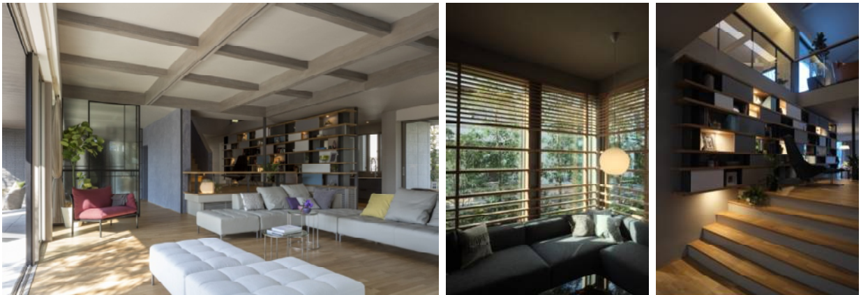
デッキとフラットに繋がる大空間、印象的な化粧梁のインテリア

折り上げ天井部では、「イズ・シリーズ」専用の半あらわし化粧梁(ダイナミックビーム)により、木材の温かみと鉄骨造ならではの軽快でシャープな印象を打ち出しています。床のアップダウンの組み合わせも多彩で、折り上げ天井や「ピットリビング」を組み合わせることでダイナミックな床レベル差を設け、天井高最大3.31mの開放的でメリハリのある空間提案も可能です。