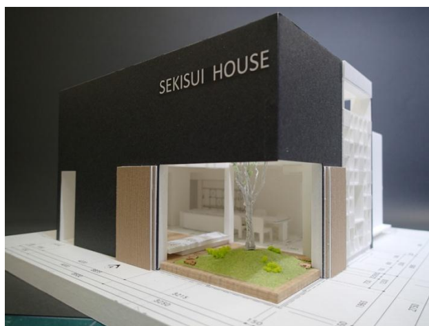
「都市に住む」展示イメージ

積水ハウス株式会社(本社:大阪市北区、社長:阿部 俊則)は、都市部での人とのつながりをテーマに、新しい住まいのあり方を提案する、体験型コンセプトモデル空間「都市に住む」を、大阪で10月12日(水)～14日(金)に開催される「LIVING & DESIGN 2016」と、東京で10月26日(水)～31日(月)・11月2日(水)～7日(月)に開催される「TOKYO DESIGN WEEK 2016」に出展します。