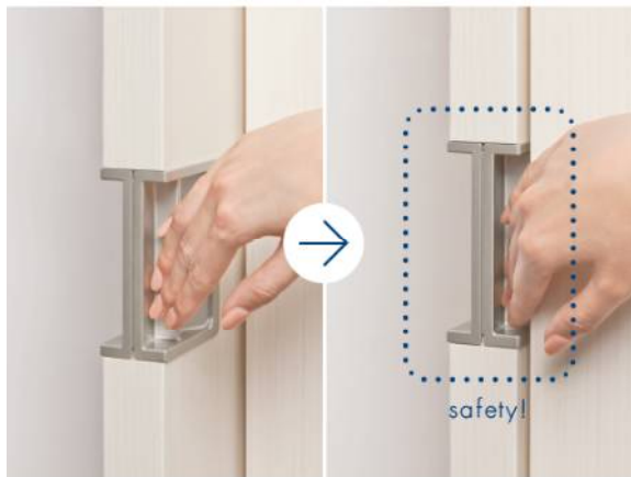
指は戸の引込み時に自然と外へ

手掛け部に手を掛けてしまえば、引き込まれた時点で指は自然に枠外に逃げていくので、扉をしまうときに指をはさみにくくなりました。