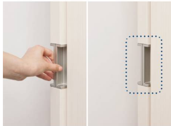
小口引手がなくなりスッキリ

引戸の木口に引手が取付けられているため、扉が完全にしまわれた状態でも「つかんで引く」だけで、簡単に引き出すことができます。