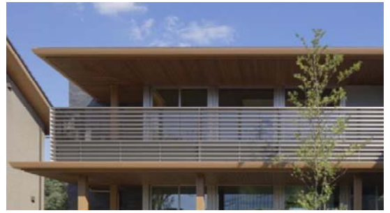
視線を遮りながら光と風を取り込む 横格子ルーバーバルコニー

段差の無いフルフラットバルコニーや、天井と同じ高さの開口部による開放感が、心地よく、快適な暮らしを実現