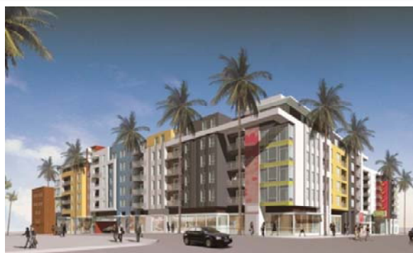
ロサンゼルス プロジェクト完成予想図