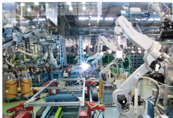
自動化率95%の製造ライン(軸組溶接工程)