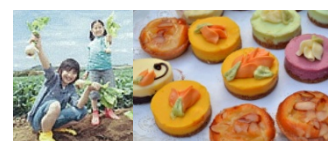
イベント例 (収穫した芋でお菓子教室)

屋上庭園を利用したサツマイモ苗植え会を開催し、秋には芋掘り会、収穫した芋でケーキ・お菓子教室を開催して、「子育て世帯」と「高齢者世帯」との交流を促進します。