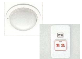
人感センサー、 緊急呼び出しボタン

室内天井に人感センサー検知通報装置を備え付け、一定時間人の動きがない場合にセンサーが作動、管理人室とセコム株式会社のセンターが連携して駆けつける体制を整えています。