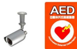
防犯カメラ、 心肺停止対応用AED

建物内に住み込みの管理人が常駐し、建物内の保全や清掃だけでなく、夜間の緊急時にも対応します。エントランスにはオートロック、ICノンタッチキーシステムを採用し、防犯カメラや、もしもの時のために心肺停止対応のAED、緊急時飲料提供ベンダーなどを設置します。各戸においては、カラーモニター付きインターホンで来訪者の確認とオートロック扉の解錠ができます。