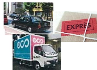
コンシェルジュサービス (高齢者世帯向けサービス)

建物内の多目的ルームや高齢者向け食堂、屋上庭園などを利用して、居住者向けの各種イベントを開催し、多世代の交流を促進します。また、地域交流をはじめ、季節イベントの企画運営や居住者主催のパーティや文化サークル活動もコンシェルジュがサポートします。