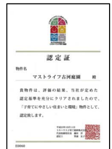
ミキハウス子育て総研 認定書

利便性や緑豊かな環境、子育て世帯と高齢者世帯の交流が図られる工夫など、共有部にも専有部にも楽しく暮らす工夫が盛り込まれている点が評価され、認定基準80項目中74.3項目をクリアして認定書の交付を受けました。