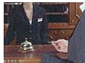
コンシェルジュサービス

「使える便利」「使える安心感」「使えることの価値」をモットーに、インフォメーションサービス、各種施設紹介手配サービス、子育て世帯向けサービス、高齢者世帯向けサービスなど多彩なサービスを提供します。