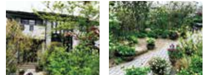
写真1枚で応募できる 「ワンショット部門」

「ワンショット部門」は携帯電話やスマホの写真1枚で簡単に応募できます。気軽にご応募ください。