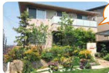
建物と いっしょに