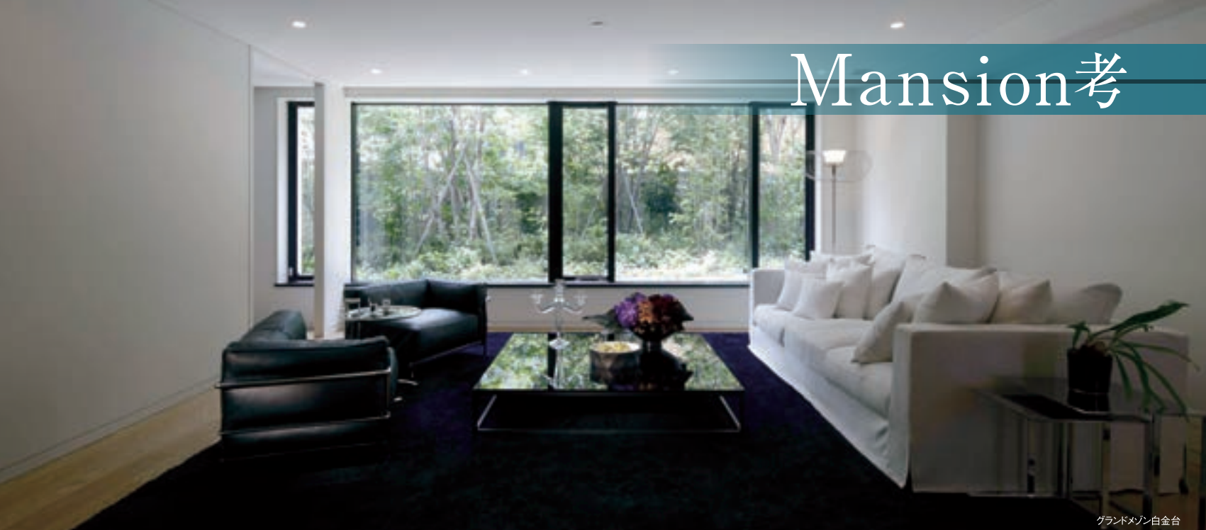
グランドマンション白金台