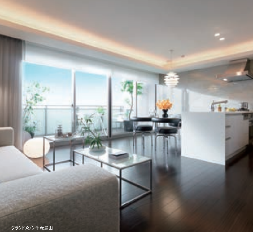
グランドマンション千歳鳥山