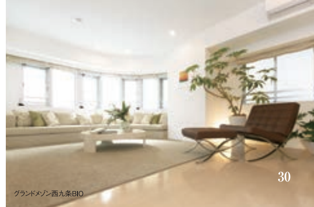
グランドマンション西九条BIO