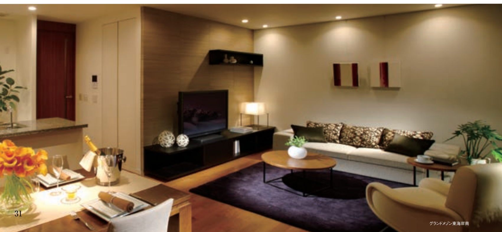
グランドマンション東海岸南