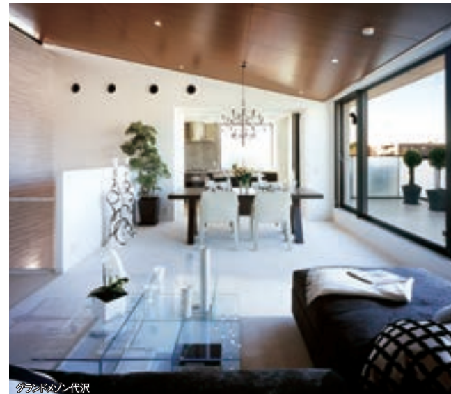
グランドマンション代沢