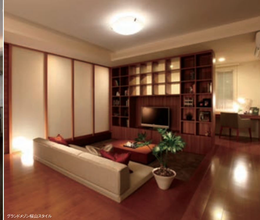
グランドマンション桜山スタイル