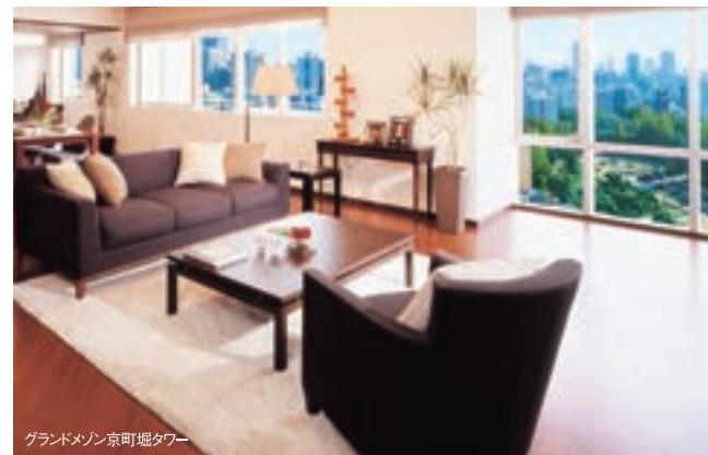
グランドマンション京町堀タワー