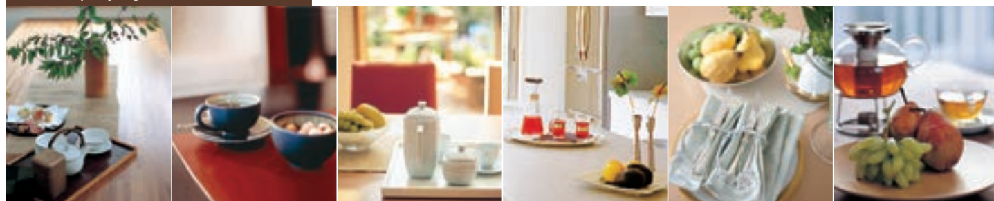
table top styling /好きなテーブルの風景は?