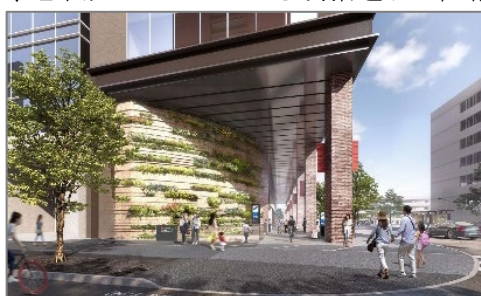
▲地上プロムナード（南棟）

地上と地下のプロムナードは明治通りと昭和通りを繋ぎ、街の回遊性を高めます。地上プロムナードは半屋外空間となっており、雨天時でも快適な歩行ができます。また、各所に配置したベンチや壁面緑化、街路樹により、福岡市が都心の森1万本プロジェクト ※3 にて目指す、憩いや安らぎを感じられる街並みの創出に貢献しています。アートが設置された明治通り側の地上と地下を繋ぐ立体広場は、地下鉄コンコースから明治通りに直結する動線を確保し、利便性の高い空間としています。