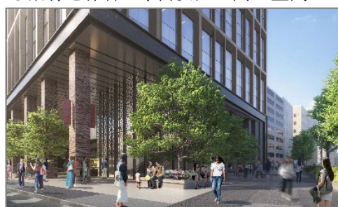
▲地上プロムナード（北棟）