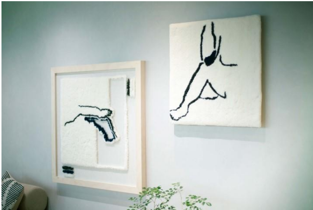
WORKS BY SAYO WATANABE ※1

今回、初めてとなる実証実験イベントとして、高島屋大阪店の催事場にて、「アートが心身にもたらす効果」に関する実証実験を実施します。実験参加者に、ウェアラブル端末を装着してもらい、鑑賞前後の生体データやアンケートをもとに分析します。