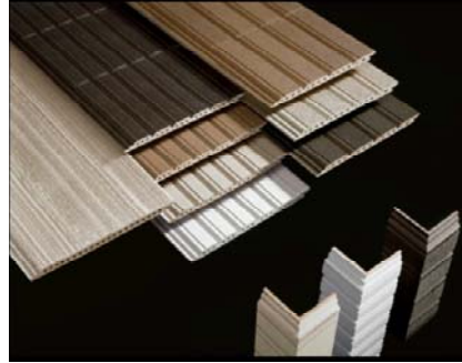
「ベルバーン」の表情豊かな意匠と質感