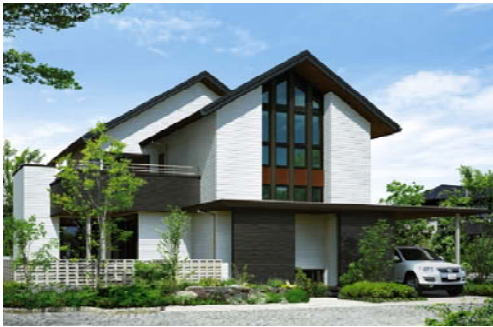
「ベルバーン」を使用した シャウッド「グラヴィス・ヴィラ」