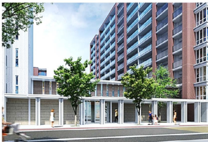
▲ 建替え後完成予想 CG