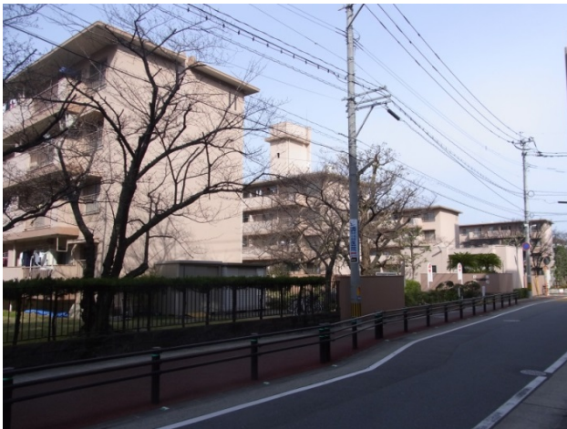
▲「藤崎公団住宅」現況写真

藤崎公団住宅（1969年全体竣工）は、福岡市営地下鉄空港線「藤崎」駅から徒歩2分に位置する、日本住宅公団（現:UR 都市機構）が分譲した全4棟・地上4階建・総戸数112戸の集合住宅（団地）です。本建替えは、築年数の経過による設備の老朽化、エレベーター未設置等バリアフリーへの未対応、住戸面積の狭さ問題などから、2007年から検討されてきました。2015年より管理組合にて株式会社ラプロスを建替えアドバイザーに迎えて本格的な検討を行い、同年5月に建替え推進決議を可決。2016年6月に三菱地所レジデンス・福岡地所・積水ハウスが事業協力者として選定され、同年12月に建替え決議が成立しました。今後は区分所有者がマンション建替組合の組合員となり、2017年12月頃に権利変換計画の認可取得、2018年4月の着工を予定し、2020年5月の竣工を目指します。建替え後は地上12階建・総戸数231戸のマンションへと生まれ変わります。