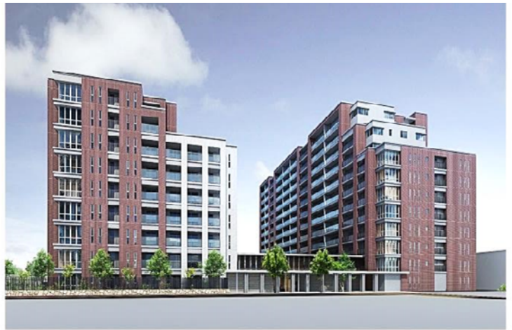
▲建替え後完成予想CG

これまでに全国で15件のマンション建替え実績のある三菱地所レジデンス、福岡都市圏での豊富なマンション開発実績を持つ福岡地所、積水ハウスが事業協力者となり、これまで九州・沖縄において5件のマンション建替え実績のあるラプロスが建替えアドバイザーとなることで、ノウハウを活かして組合員や地域の皆様にご満足いただけるよう事業を推進しています。