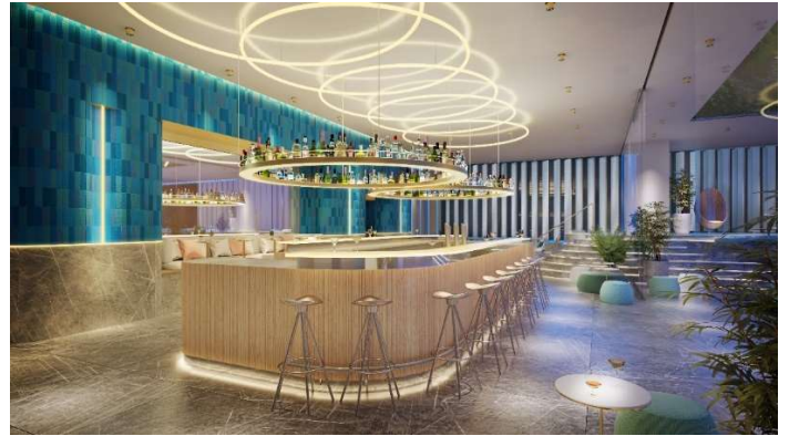
色鮮やかで遊び心あるユニークなバー（イメージ）