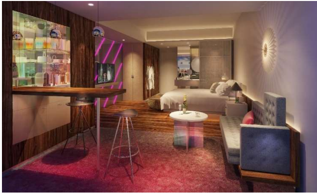
大胆な W デザインのゲストルーム（イメージ）