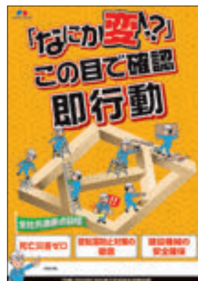
2020年度 スローガンポスター