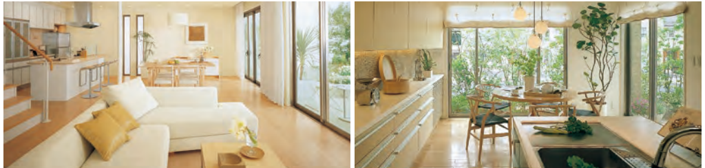
リノベーション施工例