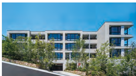
「グランドメゾン山芦屋」(兵庫県芦屋市)