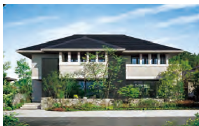
鉄骨2階建て住宅「イズ・ロイエ」