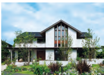
木造住宅シャーウッド「グラヴィス・ヴィラ」