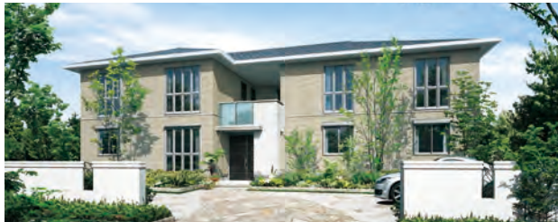
2階建て賃貸住宅「プロムープ」