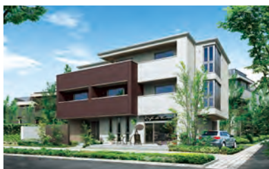
3・4階建て賃貸住宅「ベレオ」