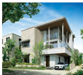
鉄骨3・4階建て住宅「ピエナ」