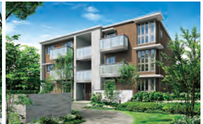
3・4階建て賃貸住宅「ペレオ」