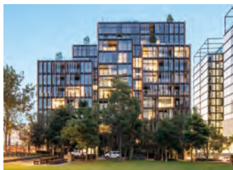
オーストラリア「セントラルパーク」