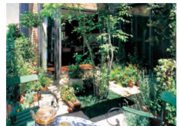
「5本の樹」計画による外構造園施工例