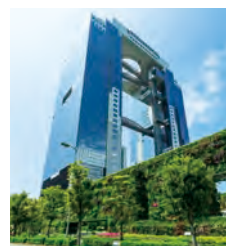
「梅田スカイビル」(大阪市)