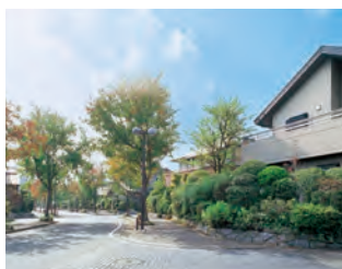
「シーサイドもち」(福岡市)