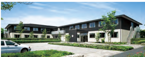
サービス付き高齢者向け住宅「セレブリオ」