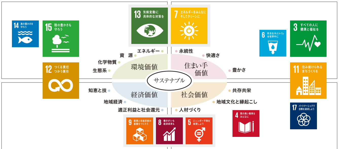
ピクトグラムの大きさと当社グループの「4つの価値」とのかかり度合いを概念的に表現しています。