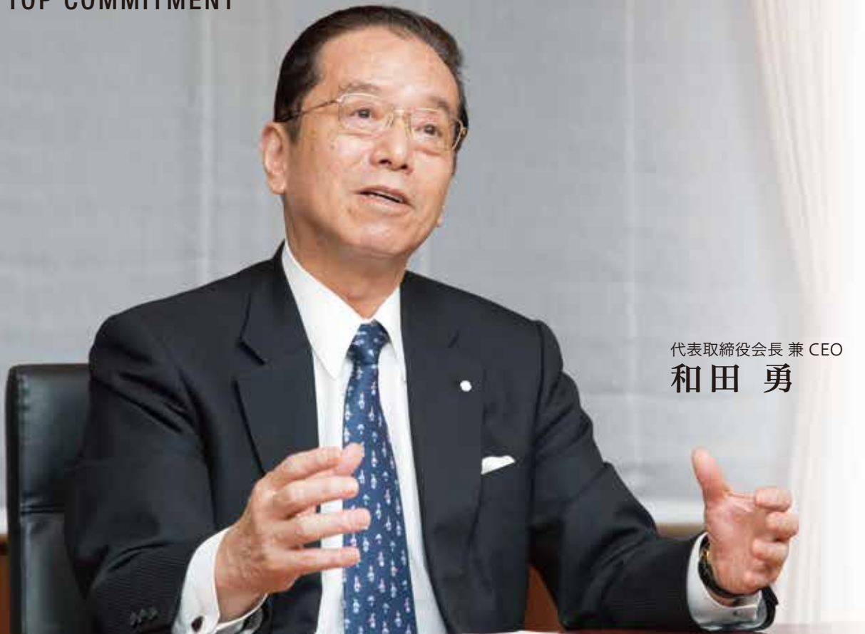
代表取締役会長 兼 CEO