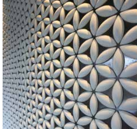
白い焼き物タイル張りの壁(ロビー)