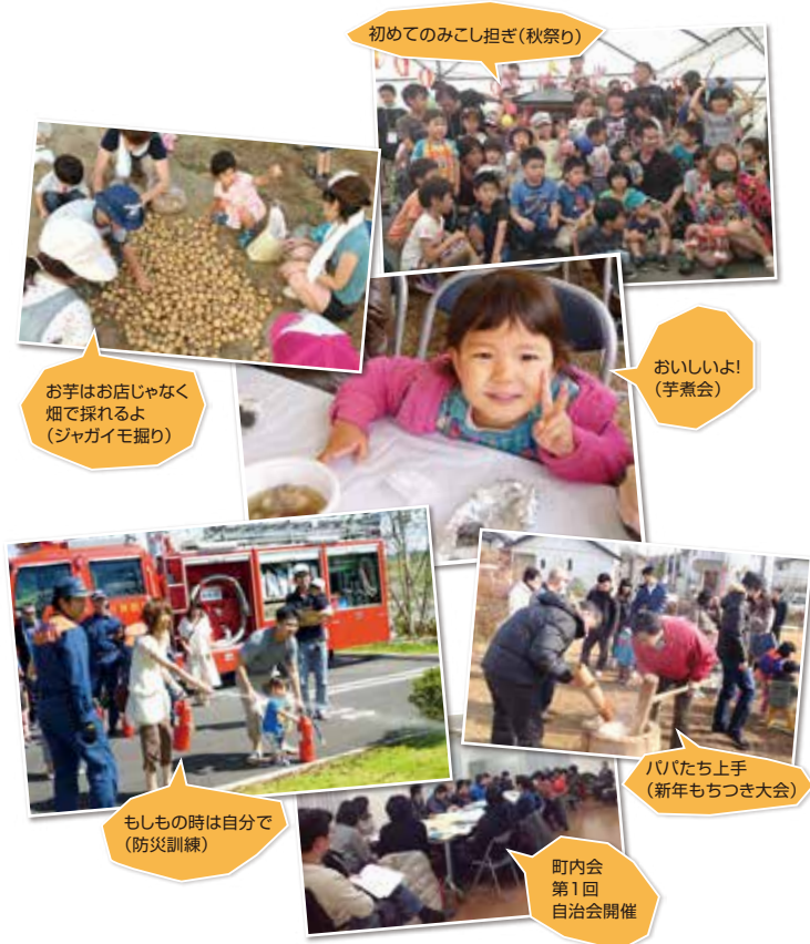
初めてのみこし担ぎ(秋祭り)

「ひとえん」の実施にあたっては、長期休暇や学校行事と重ならないように配慮してイベント日程を組んでいます。イベントの企画運営は「スマートコモンシティ明石台」の設計・分譲販売・管理を行う、積水ハウスの仙台北支店が担当しています。