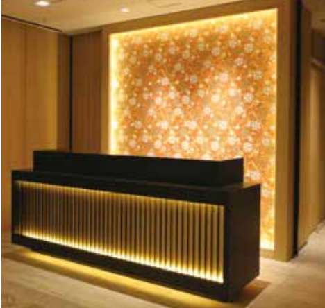
西陣織のアクセントウォール(クローク)