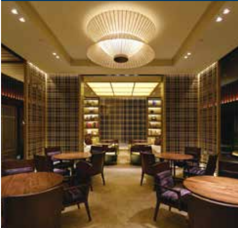
和のテイストを取り入れたロビーラウンジ

概要 ◆建築地 京都市中京区 ◆敷地面積 5,937.28㎡ ◆延床面積 24,629.66㎡ ◆地上5階、地下2階、RC造、一部SRC造 ◆客室数 134室