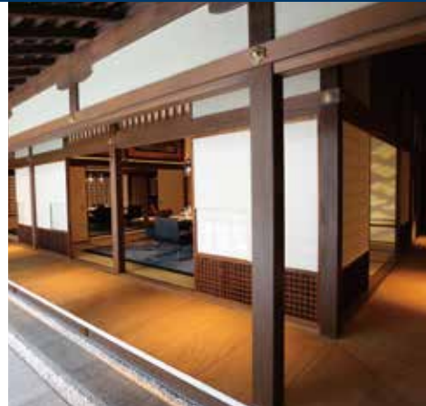
イタリア料理店「La Locanda(ラ・ロカンダ)」の店内に復元された夷川邸