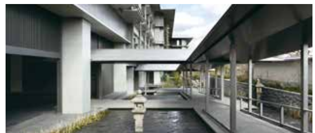
再利用した灯笼をアクセントにしたアプローチ

ザ・リッツ・カールトン・ホテル・カンパニーと積水ハウスは、歴史ある国際観光都市・京都にふさわしい次世代に継承されるホテル建設によって、京都に新たな魅力を付加し、日本文化の国際的な発信拠点として地域に貢献していきます。