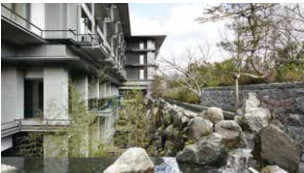
「ホテルフジタ京都」で使用されていた滝石を再利用

また、ロビーや客室の窓を通して眺める景色は、室内に居ながら四季折々の山水や草木をめでることができ、当社が提唱している室内と屋外を緩やかにつなぐ「スローリビング」の考え方にも通じる、庭と建物が調和したしつらえとなっています。