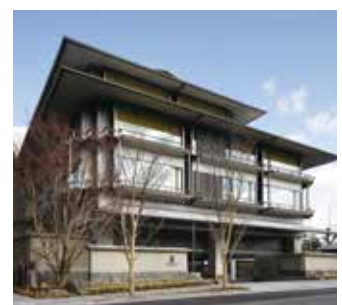
日本建築のデザインを基本とした外観

良好な都市景観の保全を目指した京都市の厳しい建築規制を遵守し、施設の約半分は地下に設置。室内の吹き抜けや滝が落ちるドライエリアを設けて自然光を取り入れるなど、地下を意識させない工夫を凝らしました。建物は、日本の伝統的建物を感じさせる雁行した建物配置や折り重なる屋根形状を取り入れ、周辺建物との干渉を極力減らした中庭形式の配置となっています。日本の伝統と現代的な欧米の様式の融合を図りながら、歴史ある周辺環境にも調和したデザインを実現しています。