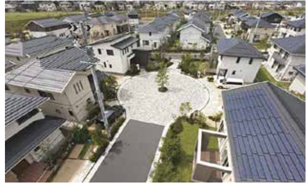
「クルドサック」に面した3電池搭載の「グリーンファースト ハイブリッド」街区。停電時も電灯がともり、災害時には広場が住民の避難場所になります