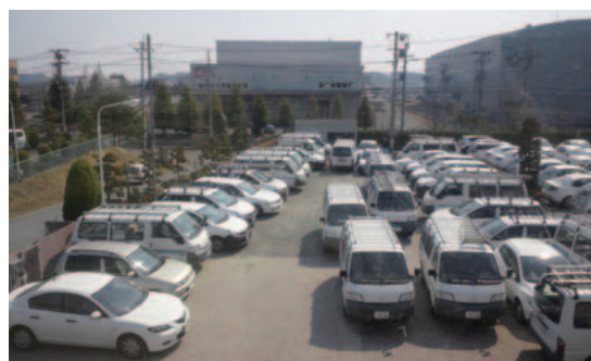
支援チームの車両で駐車場は満杯