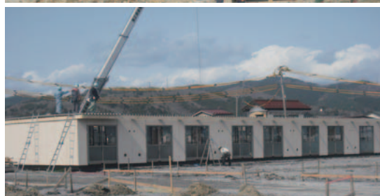
急ピッチで進む仮設住宅の建設

政府・自治体の協力要請に応え、仮設住宅の建設にも協力しています。当社は宮城県、岩手県、福島県で着工。断熱性に優れ、バス・トイレを完備した仮設住宅（約4000戸を予定）が、全国から応援に駆け付けた施工担当者により急ピッチで建設されています。