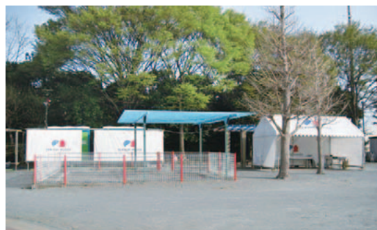
仮設トイレを分譲地内の公園に設置