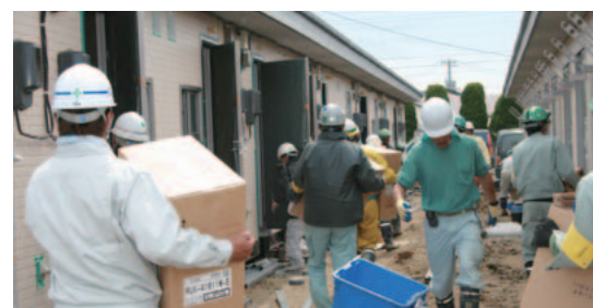
全国から駆け付けた多くの施工担当者が建設に従事