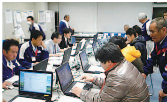
全国のカスタマーズセンター従業員が全国から応援に

震災による停電などの影響で一時稼働を停止していた関東工場、東北工場が約1週間で復旧し、生産・出荷を再開しました。また、今後の復旧・復興工事に必要な資材の調達に関しては、取引先各社に積極的に働きかけ、早期に安定供給体制を整えました。