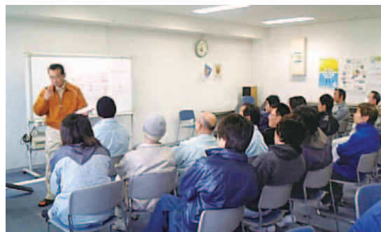
協力工事店とともに復旧対策会議