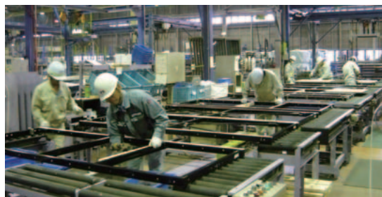
高品質かつ迅速な生産で早期復興を推進（東北工場）

被災地では揺れそのものによる全半壊棟数はゼロで、制震システム「シーカス」をはじめ、当社住宅の耐震性に対して高い評価をいただきました。高性能・高品質な建物で復興住宅ニーズに応えていきます。