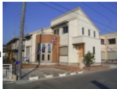
「住宅防災仕様」 分譲住宅 2004.11 (埼玉県熊谷市)