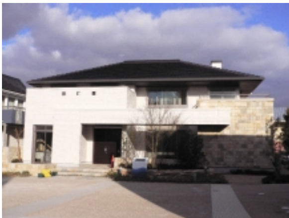
明石海岸通展示場 「住宅防災」仕様 2005.1 (兵庫県明石市大蔵海岸通)