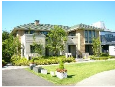
関東工場 「住まいの夢工場」 住宅防災展示館 2004.9 (茨城県総和町)

「住宅防災仕様」は、大地震時に強いというだけではなく、被災後の生活に焦点を当てたアイテムです。したがって、その意義と役割をご理解いただくには、生活シーンを再現し、被災時の生活イメージを実物を通して体験して頂くことが、より効果的であると考え、積水ハウスでは「住宅防災仕様」の展示場や実物件を積極的に展開し、公開しています。