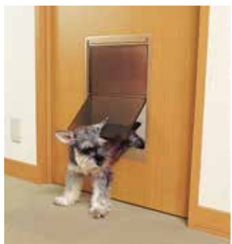
ペットが自由に入出りできるくぐり戸付きのドア。くぐり戸のサイズなどは、住生活研究所における実験から導き出した規格があります。

「扉は、家族みんなが開け閉めするもの。積水ハウスのスマートUDという考えに基づき、使いやすく、美しく、心地よいユニバーサルデザインを随所に施しています」(石井) 「たとえばショートストロークレバーハンドルは、ちよつと下に動かすだけで開けられるため、手首への負担を軽減できます。お行儀が悪いかもしれませんが、肘で開けることもできて、大きな荷物で両手がふさがっているときにも便利です」(樺村)