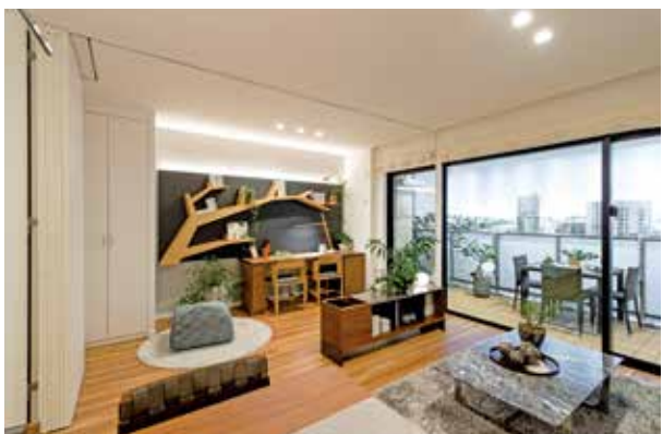
天井までの高さのあるウォールドアで、生活シーンに応じて空間を使えるフレキシブルな住まいに。(GM品川シーサイドの杜/東京都)