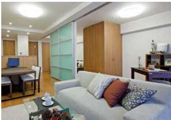
空間を自由に仕切れるスクリーン建具のあるLDK。スクリーンを閉めても家族の気配や光を感じられます。(GM自由ヶ丘テラス/愛知県)

「重厚感のある大型の扉や、華やかさをプラスする親子扉、扉まわりの枠を太くして上質な雰囲気にするなど、住まう人の個性やライフスタイルをイメージして、らしさを演出する扉をご提案しています。モデルルームを訪れた際には、扉のデザインに着目してみるのも面白いですよ(佐藤)」