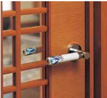
九州らしさを追求し、伊万里鍋島焼を採用したオリジナルのレバーハンドル。その質感や高度な技法により表現された立体感のある絵柄が、住まう人の心を満たします。(GM大瀬ORGA/福岡県)

「GMでは、数十年前から戸建て部材をマンション用にアレンジした工場出荷材を採用しているというのが、大きな特徴の一つとして挙げ