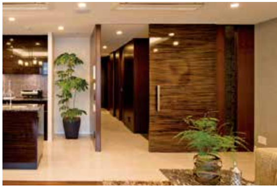
邸宅の趣を高めているのは、存在感のある大きな引き戸。素材や色に統一感があるため、落ち着いた上質な空間に仕上がっています。(GM上原サロン/東京都)

あらためて考えてみると、住まいの中には多くの扉がありますね。 「建築用語では、建具」という言葉を使いますが、そこにはリビングや各個室の出入扉、収納の扉、玄関扉、窓のサッシなどが含まれます。意外に思われるかもしれませんが、そうした建具は、空間のトータルイメージを演出する上で重要なアイテムなんですよ(棟村)」「インテリアを考える際、床や壁の色・素材などはよく着目されますが、家具を置いてラグを敷いてみると隠れてしまう部分も多いんです。でも扉は開閉するところですから、家具などで隠れることがありません。そのため、インテリアコーディネートの要とも言えるので