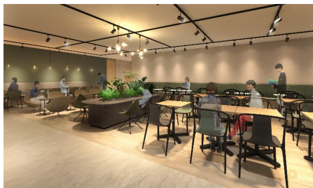
南館の休憩室 ※2025年春頃オープン予定