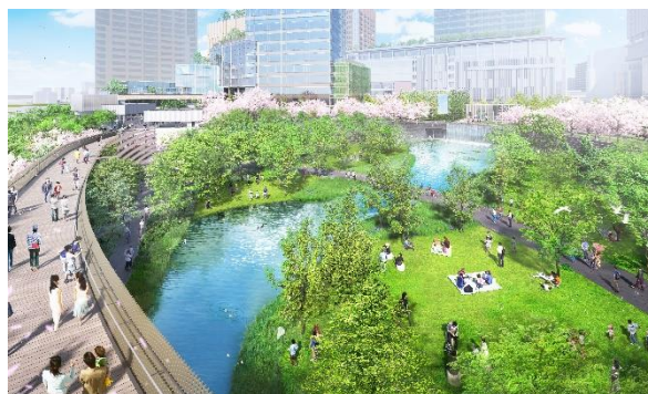
うめきた公園ノースパーク