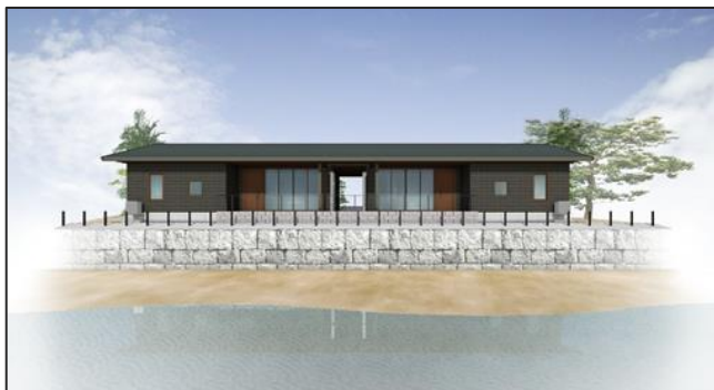
▲博多湾を一望できる宿泊施設「ヴィラ」