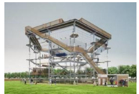
▲アスレチックタワー イメージ

博多湾を一望できる立地を生かして、子どもから大人まで楽しめる大型アスレチックタワーを新設します。ドイツ製の本施設は3層高さ約17mと九州で最大級の規模を誇り、かつ自然に調和したデザインです。遊びを通じた運動能力の向上や家族間やグループ間の会話が生まれ、コミュニケーション向上も図れると好評の施設です。