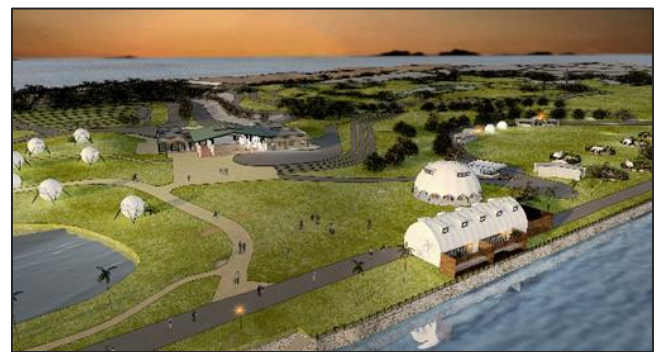
▲海風と緑に囲まれた開放的な宿泊エリア