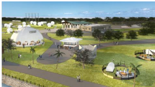
▲滞在型レクリエーション拠点 イメージ