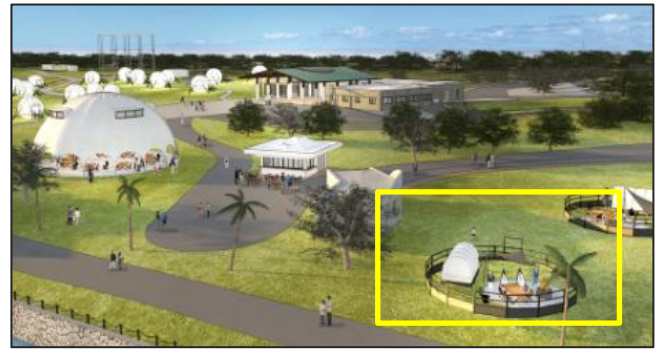
▲自然との一体感を味わえるアウトドアリビング（右下 黄色枠）