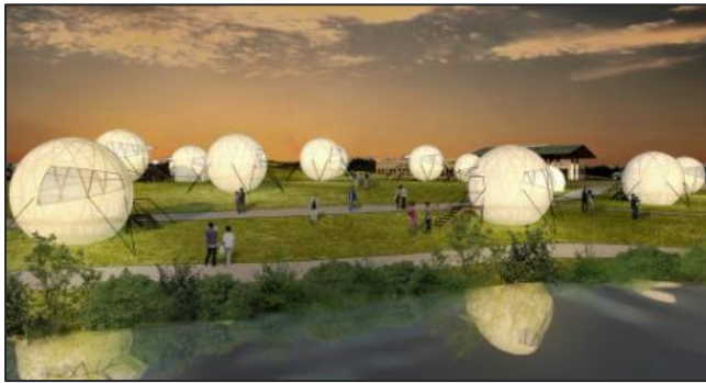
▲カモ池のロケーションを活かした球体テントを整備