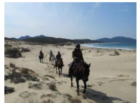
▲ホーストレッキング イメージ

玄界灘海浜部にみられる白砂青松と青い海、志賀島方面につづく細長い地形が特徴的な“海の中道”を堪能するホーストレッキングを提供します。