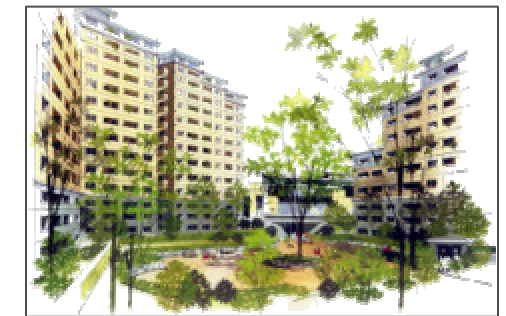
集合住宅イメージ