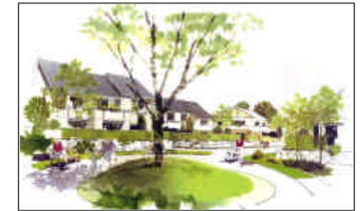
戸建エリアコモンイメージ

家族同士のふれあい・コミュニケーションが増え、子供も安心して遊べるコモンひろばを演出します 集合住宅からの視線考慮しながらコモンへ開放性を重視した配棟計画とします 外観表現は切妻・片流れを基本とし、屋根面を見せながらシルエット調整を図ります