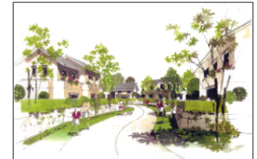
戸建エリア内幹線道路イメージ