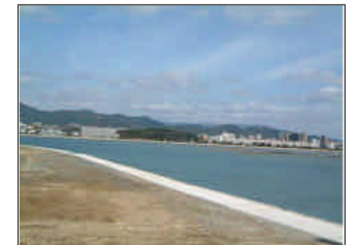
御島ゾーンから対岸を望む

浜辺から続く緑の中に見え隠れする低層の戸建住宅。その先に豊かな緑に包まれた中高層の集合住宅がなだらかに続いています