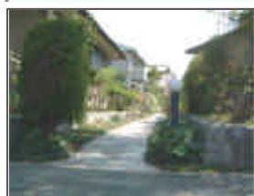
フットパスイメージ

戸建て住宅内の公園、海浜緑地や海をつなぎ、回遊性を高め海への眺望も確保するフットパスを設けています