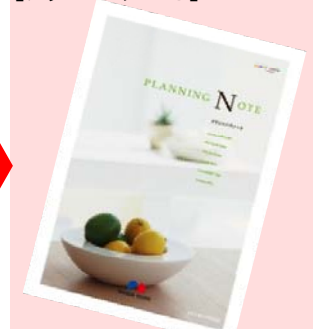
【プランニングノート】

6つの便利ツールを使ってご自身で収集・作成した情報は1冊の本にまとめることが可能。