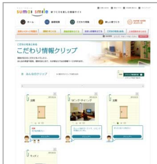
【こだわり情報クリップ】