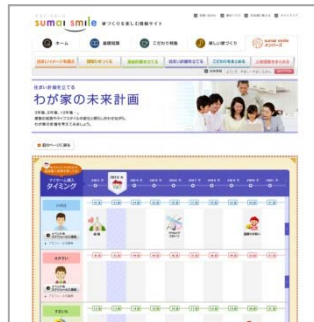
【わが家の未来計画】