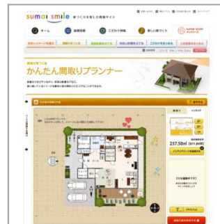
【かんたん間取りプランナー】