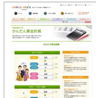
【かんたん資金計画】