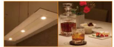
団楽のあかり スポットライトのみ

配光制御技術の採用で、手元に影ができにくく、気になるチラつきを抑制。ダイニングが読み書きに集中できるあかり環境になることで、安心して子どもの勉強姿を見守ることができます。