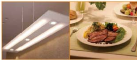
食事のあかり 全灯

また、目の届くところで子供が勉強をするメリットにも注目し、ダイニングテーブルでの読み書きに適した照明設定を可能にするなど、シーンにあわせて快適で魅力的な食卓空間を演出します。