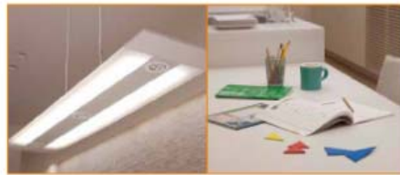
勉強のあかり ベースライトのみ

スポットライトとベースライト、ふたつの光源を効果的に生かすことで、朝食や夕食などの食事のシーンに合わせた最適なあかりに、料理の色を際立たせ、おいしさを演出します。