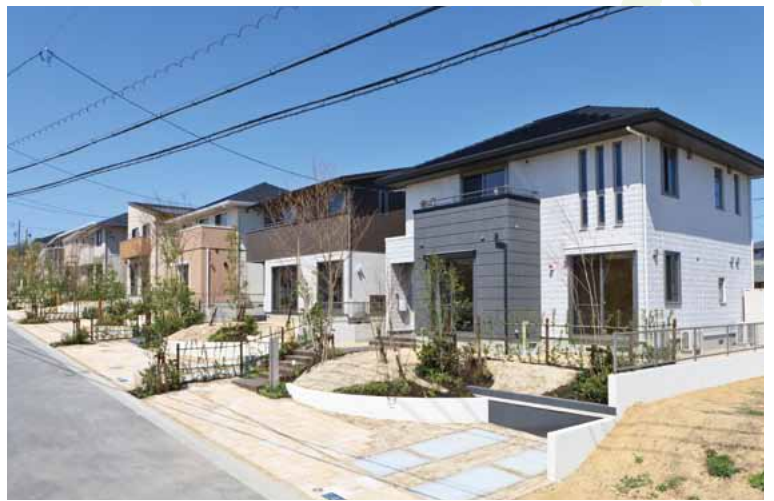
現地撮影(平成23年4月)

太陽がほほえみ、生命の息吹きがこだまする。 積水ハウスがお届けする「コモンステージ陽だまりの丘」は、そこに暮らす家族が、美しく彩られる自然と共鳴しながら、確かな未来をともに紡いでいく場所です。 親から子へ、子から孫へ、そして次の世代に続いていく「幸せ」という価値を、あなたへ。