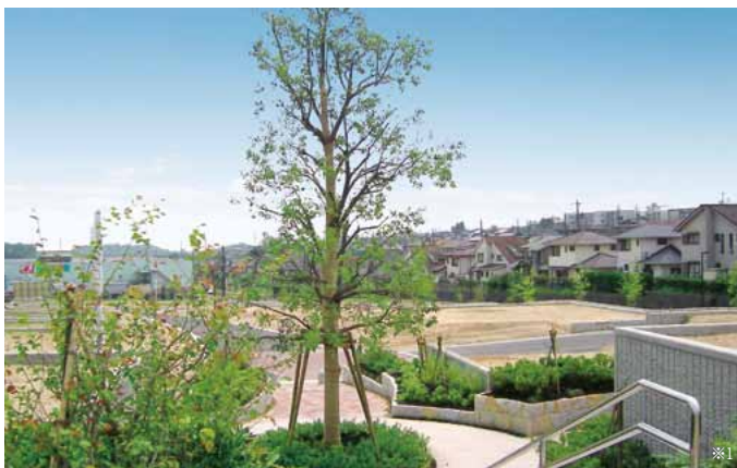
※1 現地撮影写真(平成21年6月13日)

街並みに豊かな表情を加えるシンボルツリー。積水ハウス「5本の樹」のコンセプトが息づく憩いの場所です。50年後、100年後も街を見守るランドマークとなるでしょう。