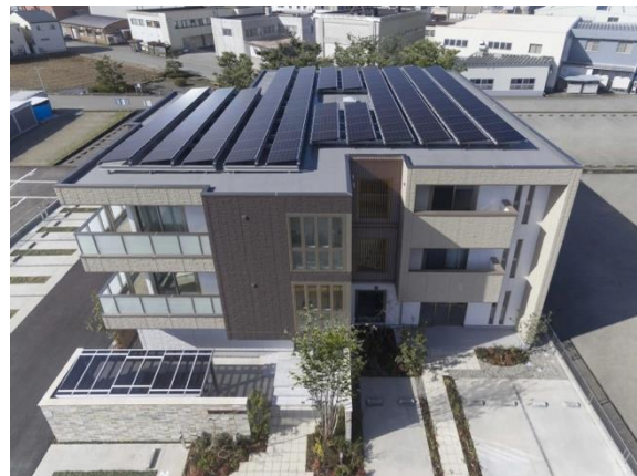
シェアメゾンZEHの例

積水ハウスは、集合住宅において住戸毎に専用接続する EV 充電器の設置に取り組むなど、ZEH を基軸にした、カーボンニュートラル時代の新しいライフスタイルを誰もが選べる社会の実現に向け、業界を超えた連携を推進してまいります。